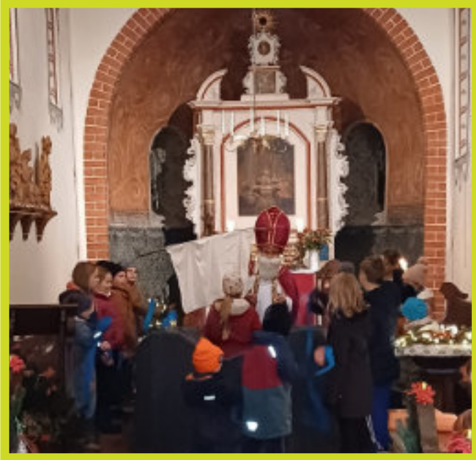
Der Nikolaus bringt in Grubo ein gekapertes Schiff zurück