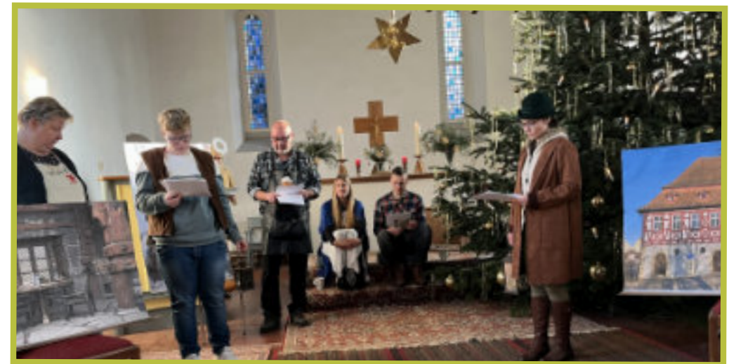
Krippenspiel in Boßdorf